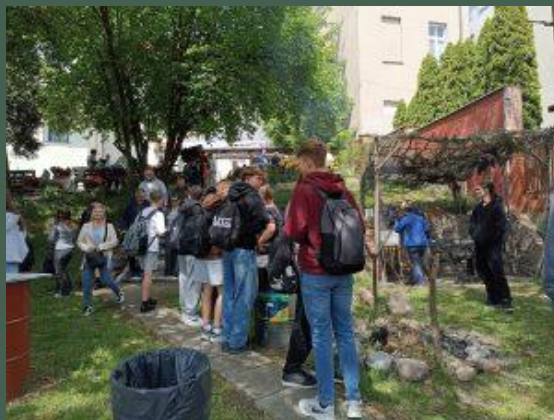
„Kwiatek dla biblioteki” (05.2025)

Skonsultowano listę zakupów z czytelnikami w celu określenia ich oczekiwań w zakresie nowych pozycji książkowych. Udział uczniów naszej szkoły w imprezach zorganizowanych przez Chełmżyński Dom Kultury oraz PiMBP.