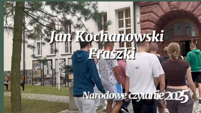
„Narodowe Czytanie” (09.2025)