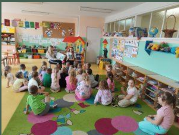
„Czytanie zbliża” czytanie bajek przedszkolakom (06.2025)

https://zsp-chelmza.pl/szkola/biblioteka/prezentacja-ksiazek/