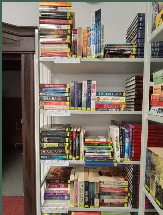
„Loteria książkowa” (10.2025)