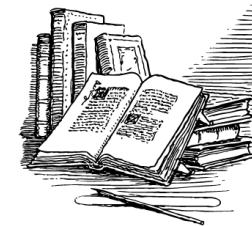
„Czytelnik roku 2025/2026” (06.2026)

Konkursem objęci są wszyscy uczniowie ZSP w Chetmży. Dla najlepszego czytelnika przewiedziana jest nagroda.