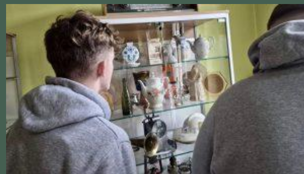
Zajęcia integracyjne klasy 2 FK w Miejskiej Izbie Muzealnej (11.2025)