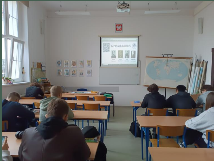
„Patroni Roku 2025” (10.2024)