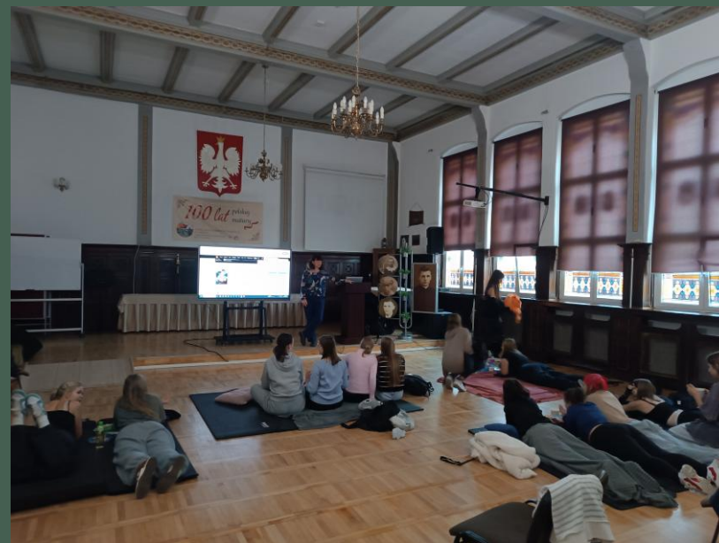
„Wieczór filmowy” ekranizacja powieści Tess Wakefield „Purpurowe serce” (10.2025)