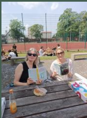
„Czytanie na trawie” (06.2025)