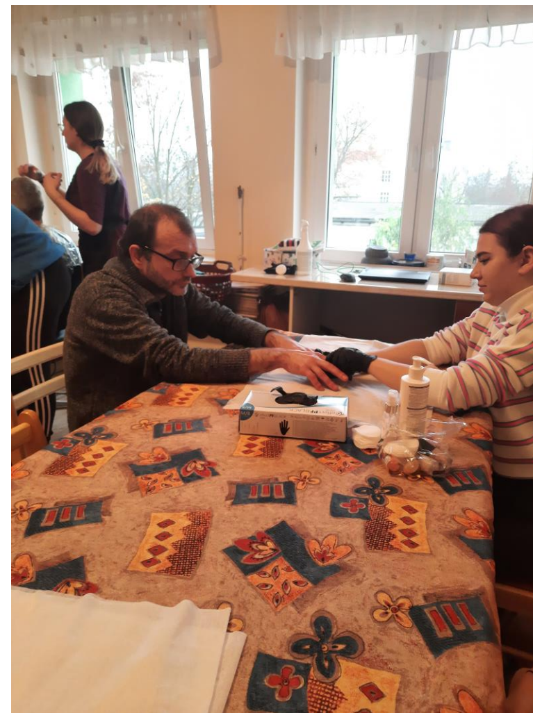
masaż i pielęgnacja dłoni