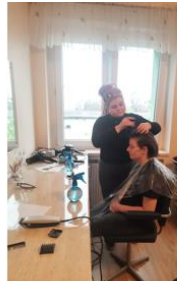
strzyżenia damskie, męskie i modelowanie