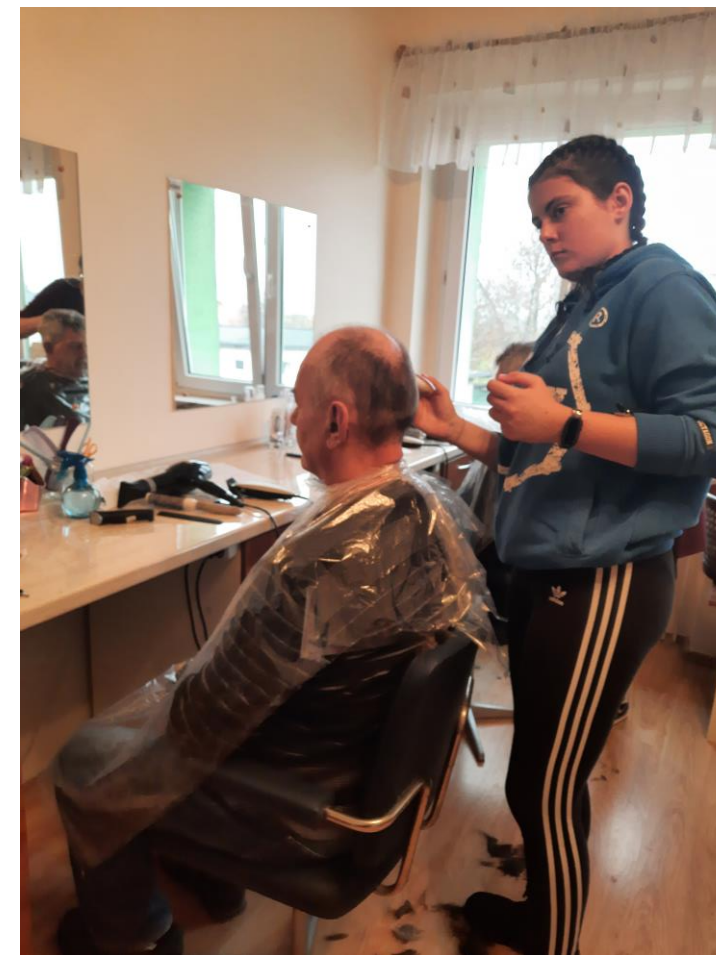
strzyżenia damskie, męskie i modelowanie